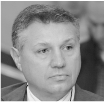
ВЕЛИЗАР ШАЛАМАНОВ е бивш заместник-министър на отбраната