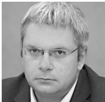
МОМЧИЛ МЕТОДИЕВ е автор на книгата "Машина за легитимност" за историята на ДС