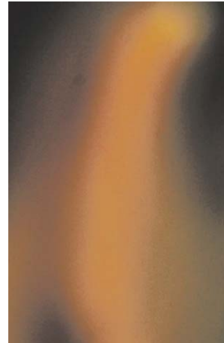
Брифинг в ДАНС - след скандала около

Но това, което е конкретно изискване към самата институция ДАНС, е свързано с това дали тя е видима за хората. Не е видима. В началото на 90-те години гражданите искаха видим сектор за сигурност. Искането тайната да се замени с прозрачност. Искането да стане ясно какво правят тези хора там, с каква цел го правят, защо разходват парите и колко пари разходват на данъкоплатеца. Поради което към всички други неща, които тук се казаха за ДАНС, аз добавям изискването за прозрачност. Това означава активно предоставяне на информация. Ако човек отвори сайтовете на ЦРУ и ФБР в една страна, която е в момента в тежко положение, защото всички я обвиняват и тя сама обвинява себе си в непрозрачност, ще се види моментално стратегията на ФБР за 2012 г. Вижда се точният до единица брой на служителите - както цивилни, така и униформени, вижда се точният бюджет до стотинка. Има доклади, статистики, някакви продукти, които могат да бъдат споделени с обществото. Аз лично не бих се съгласил парламентарният контрол да казва на обществото какво прави ДАНС и да препредава информация