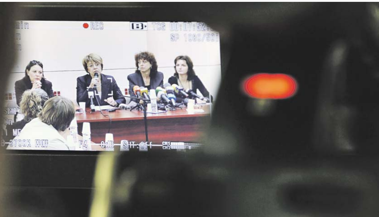
разработката „Галерията“ агенцията се опита да се отвори пред медиите

лия сектор за сигурност, липса на визия за развитие, липса на стратегия. Непрекъснати опити на управляващите политически сили да се бъркат в нейната работа. Демотивация на работещите в сектора да изпълняват своите служебни задължения, независимо от размера на заплатите. Виждате, че в ДАНС заплатите са много високи, но демотивацията и там е налице. А за МВР вече е ясно.